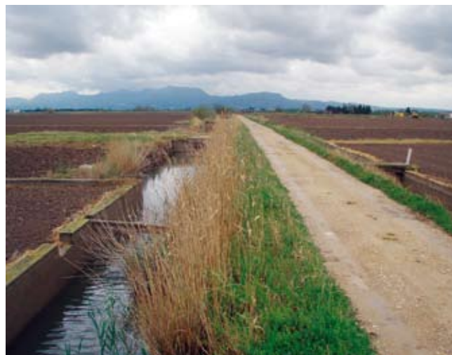
El camí d'Enmig, o de l'Alter, i la séquia d'Omella

Intervenció: aportació de pedra escullera amb una amplària d'1,50 metres a la base, i 1 metre d'alçària, que s'incorporarà al camí; posteriorment s'hi afegirà una capa de 20 cm de material granular per al ferm; profunditat de la séquia: 1,50 metres. Abans s'efectuaran els treballs de neteja i de desbrossament del terreny. Amb això es passarà dels 2,50 metres actuals d'amplària del camí a vora 4,50 metres.