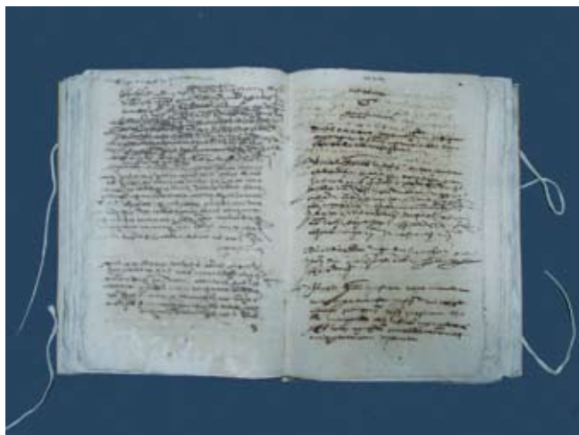
Mà d'execucions del Justícia, 1569

poder estudiar-los posteriorment, ja que es tracta de documents reutilitzats. Per això s'ha confeccionat una enquadernació nova amb pergami. Com a protecció final s'ha fet una capsa de conservació amb cartó lliure d'àcid i sense adhesiu. En el cas del Llibre de consells s'ha restaurat l'enquadernació original.