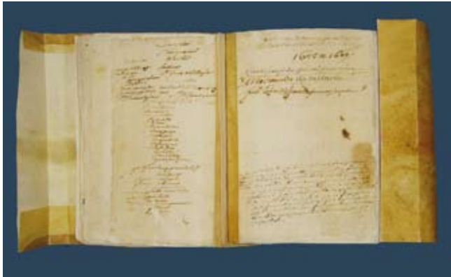
Llibre de Consells, 1639-1703

que administraven la vila. El règim municipal a l'època foral tenia diversos oficials, tal com podem llegir en la Notícia general recopilada en lo any 1704: