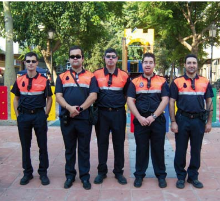
Alguns membres de l'Agrupació de Voluntaris de Protecció Civil

formitat com d'equipament) l'associació, també hi ha l'assegurança dels membres, que es renova cada any. A més s'ha presentat a l'aprovació del ple el nou reglament, i la inscripció posterior en el registre de voluntaris, perquè l'associació del nostre poble estiga coordinada amb la resta de les associacions.