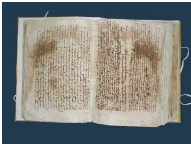
Llibre d'execucions i lletres, 1594

més per l'extensió material i cronològica, sinó també per la informació que serveixen.