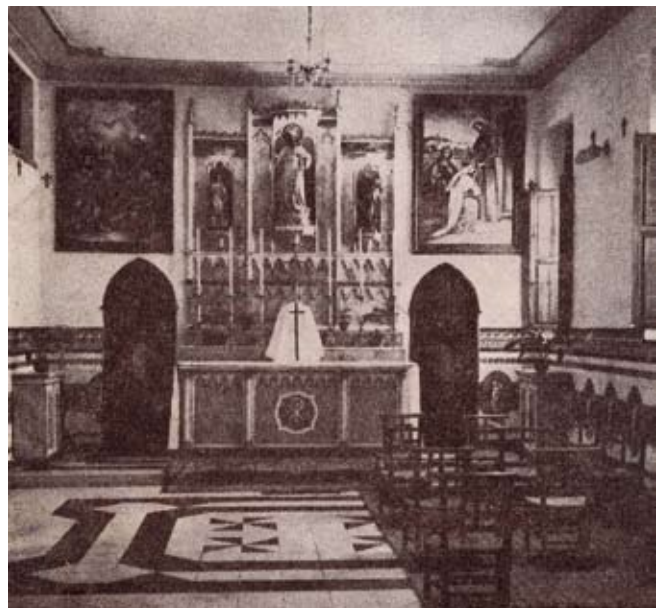
Estat original de la capella

L'ajuntament s'ha acollit al pla de restauració de béns immobles que tenen valors històrics, artístics o d'interès local de la Diputació de València i ha sol·licitat la restauració de la capella del Col·legi del Cor de Jesús.