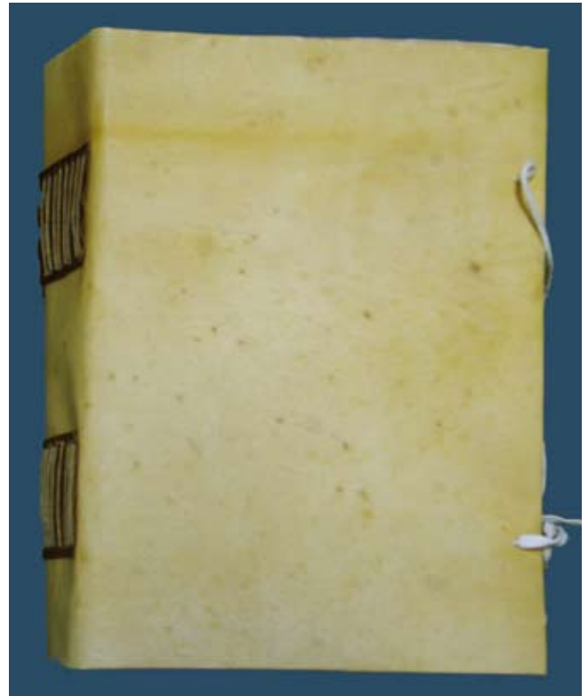
Mà d'execucions del Justícia, 1569