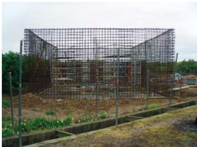
Constucció del nou dipòsit

Ja s'han encetat les obres del dipòsit per a emmagatzemar l'aigua potable sense nitrats que arribarà del Caroig; el dipòsit s'està construint vora l'actual dipòsit municipal del poliesportiu i està previst en el projecte d'abastiment d'aigua potable a la comarca de la Ribera. L'aigua emmagatzemada es transvasarà al dipòsit municipal fins a arribar al nivell de potabilització permès per al consum humà.