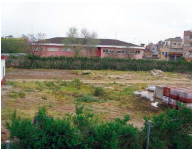
Terrenys on es construirà l'escola infantil

CONSTRUCCIÓ D'UNA ESCOLA INFANTIL de nova planta, per a adaptar el servei a les noves normatives educatives i donar una assistència més bona. Així acomplim l'esperit de la inversió, que és la de donar faena i consolidar nous llocs de treball, a més de millorar la qualitat del servei. La inversió és de 503.771 €