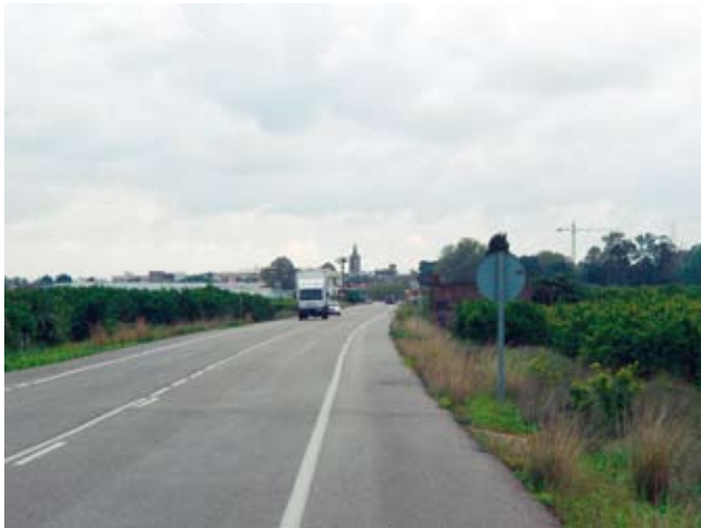
Camí de Pardines, o de València

Des que van finalitzar les obres de la carretera CV-516, que tradicionalment coneguem com a camí de Pardines, en el tram del terme d’Albalat, l’ajuntament ha insistit moltes vegades a la Diputació de València perquè acabara tot el camí (el que passa pel terme d’Algemesí) fins a la redona de la carretera CV-42 (Algemesí-Almussafes) que ens uneix amb l’eix viari cap a València (CV-42 i AP-7).