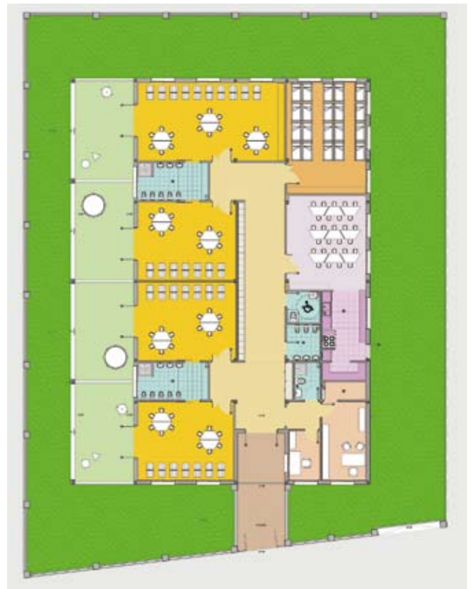
Planta de l'escola infantil

NOVA INSTAL·LACIÓ ELÈCTRICA AL POLIESPORTIU MUNICIPAL , dotació d'un enllumenat suficient i adequat al camp de futbol, amb una inversió de 69.806,86 €.