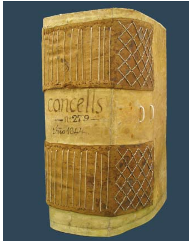
Llibre de Consells, 1639-1703

Tots els esdeveniments administratius i polítics estan reflectits en estos llibres. Mitjançant la lectura i la interpretació d'estos textos podem reconstruir el passat. Són una font de gran valor per a conèixer molts aspectes inèdits i completar els que ja coneixem de la nostra història local.