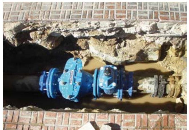
Una de les vàlvules noves