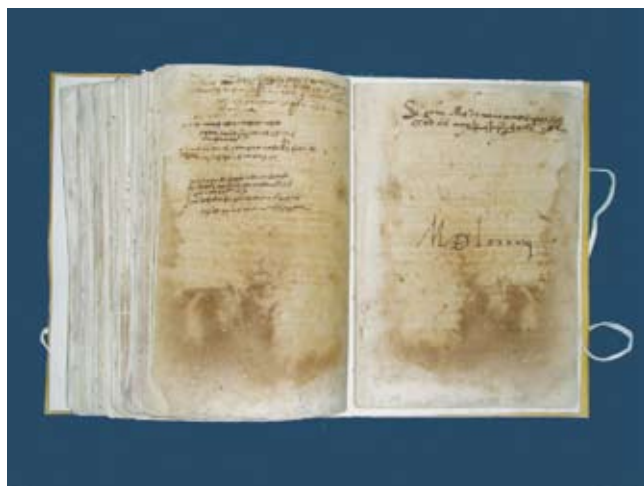
Llibre d'execucions i lletres, 1594

El Llibre de consells (1639-1703) és un dels documents de l'arxiu municipal més important, ja que recull els acords i les decisions que prengueren els jurats