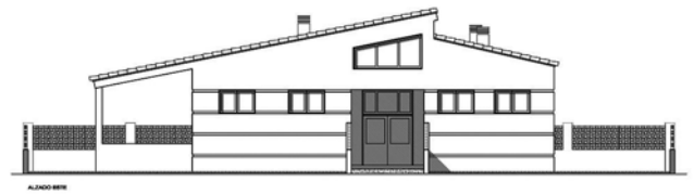
Façana de l'escola infantil

La distribució és esta: quatre aules, aula de descans, menjador, cuina, consergeria i direcció, lavabos per a xiquets i xiquetes, adults i minusvàlids, corredor de distribució, porxes coberts i pati descobert.