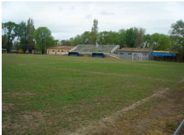
Camp de futbol

Potència: 68,480 kW. S'hi instal·laran quatre torres tubulars d'acer, de 16 metres d'alçària, i sobre estes els projectors, cinc per cada torre, per a il·luminar el camp de futbol.