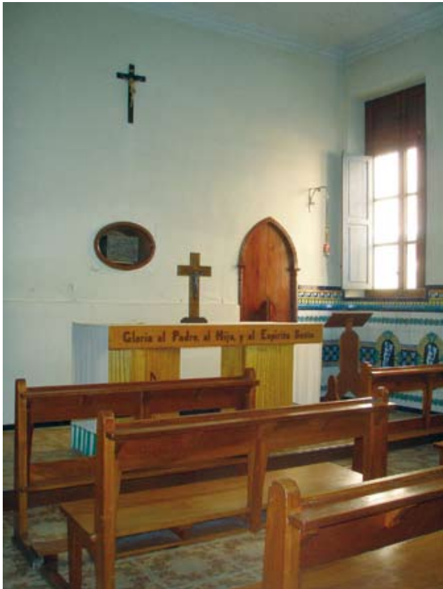
La capella ara

Per a dur-ho a terme s'ha obtingut una subvenció de vora 20.000 €, que s'invertiran principalment en la reposició d'un paviment de marbre que substituirà l'actual, ceràmic, dels anys setanta, en una instal·lació elèctrica nova, en obra de talla de guix i en pintura de la capella, i també en uns altres aspectes menors.