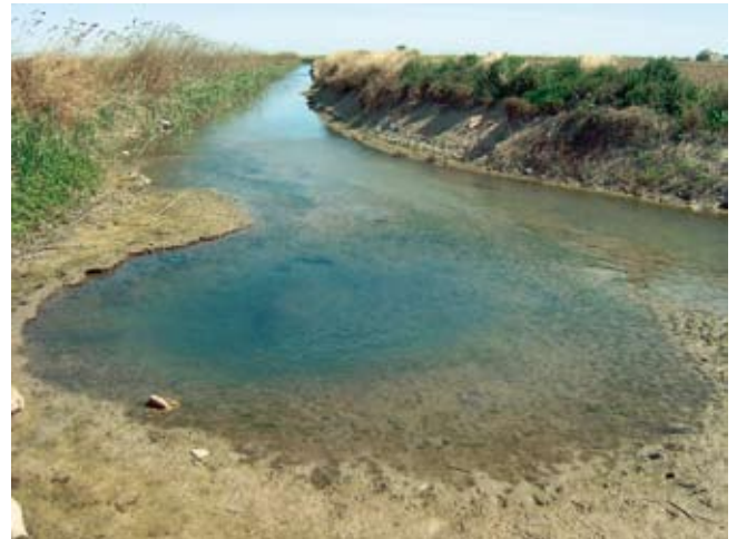
L'ullal de les Ànimes i la séquia de l'Escorredor

L'Ajuntament d'Albalat de la Ribera ha estat subvencionat per la Diputació de València amb 16.000 €, que representen el 80 % del total del pressupost de 20.000 €, per a fer una auditoria ambiental al nostre poble. L'auditoria analitzarà de manera objectiva si tenim elements adequats i efectius per a protegir el medi davant del desenvolupament de la vila.