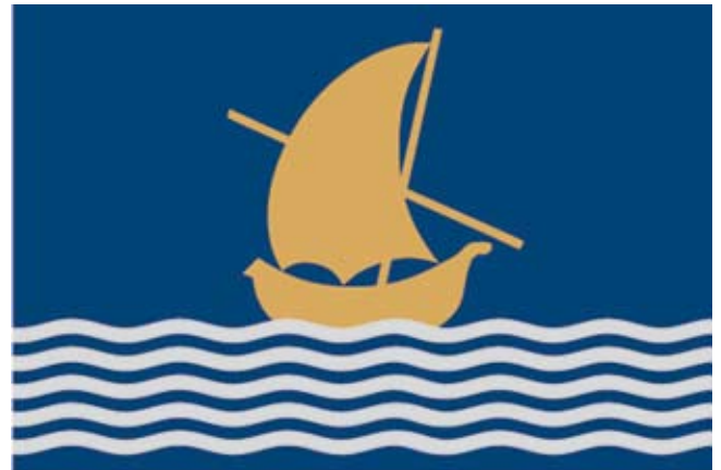
Bandera d'Albalat de la Ribera

Davant l'informe del Consell Tècnic d'Heràldica i Vexil·lologia Local que es basa en la normativa legal, el plenari, en la sessió del 18 de gener de 2008, acceptà el dictamen i aprovà la proposta tècnica següent: “bandera de proporcions 2:3. Sobre fons de blau, cinc franges onejades de blanc o argent. Al centre sobre les ones, una barca de vela llatina d'or o groga”.