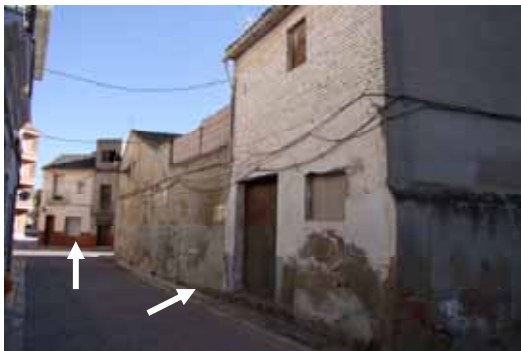
Els immobles que s'enderrocaran

En compliment de les Normes Subsidiàries de Planejament d'Albalat de la Ribera, l'Ajuntament adquirí dos immobles posats en el cantó de la placeta amb el carrer Montesa, i l'altre en el cantó de la placeta amb el carrer València i Corralot, immobles que s'han d'enderrocar per a al·liniar el carrer a l'ampliació ja efectuada anteriorment.