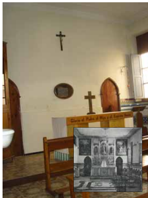
La capella abans i després de la intervenció